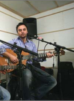
عشق، سخن سینمایی، اعتماد ملی

تازمه. تازمه یکی از تئاترهای کیش است که ریشه در آسمان دارد. تازمه یکی از تئاترهای کیش است که ریشه در آسمان دارد. تازمه یکی از تئاترهای کیش است که ریشه در آسمان دارد.