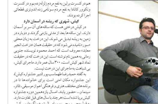
عشق، سخن سینمایی، اعتماد ملی